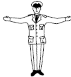
Stopteken zowel voor het verkeer dat de verkeersregelaar van voren, als voor het verkeer dat hem van achteren nadert