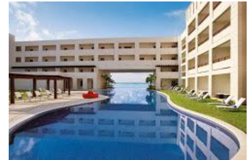
Secret Silver Sands, Cancun, Mexico