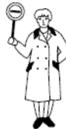
Stopteken door verkeersbrigadier met toepassing van bord F 10