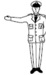
Stopteken voor het verkeer dat de verkeersregelaar van achteren nadert