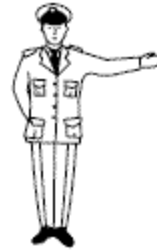
Stopteken voor het verkeer, dat de verkeersregelaar van voren nadert